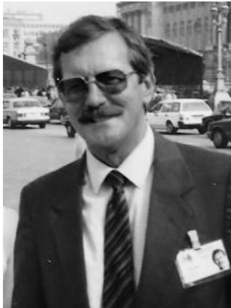
Clive Derby-Lewis (1936-2016)