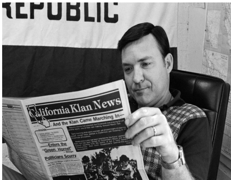
Tom Metzger (1938-2020)